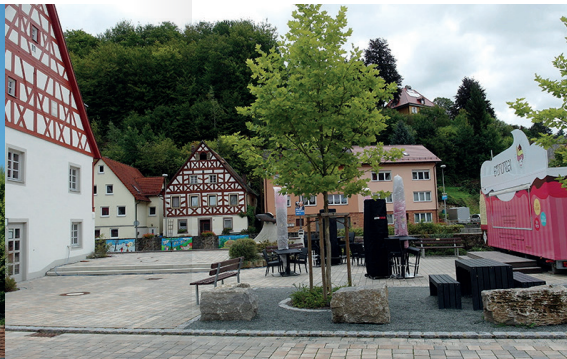
ORTSZENTRUM* (STADTPARKETT) 0,5 KM ➔