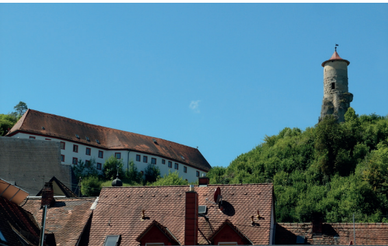
VERANSTALTUNGSORTE: BURG 1,5 KM ➔