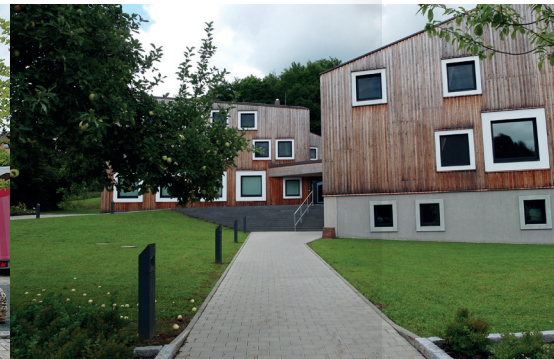
FRAUNHOFER FORSCHUNGSCAMPUS 2 KM ➔